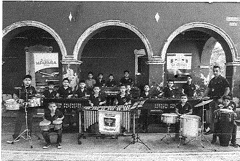
Grupo de Marimba Academia Comunitaria de Marimba Palín, Escuintla